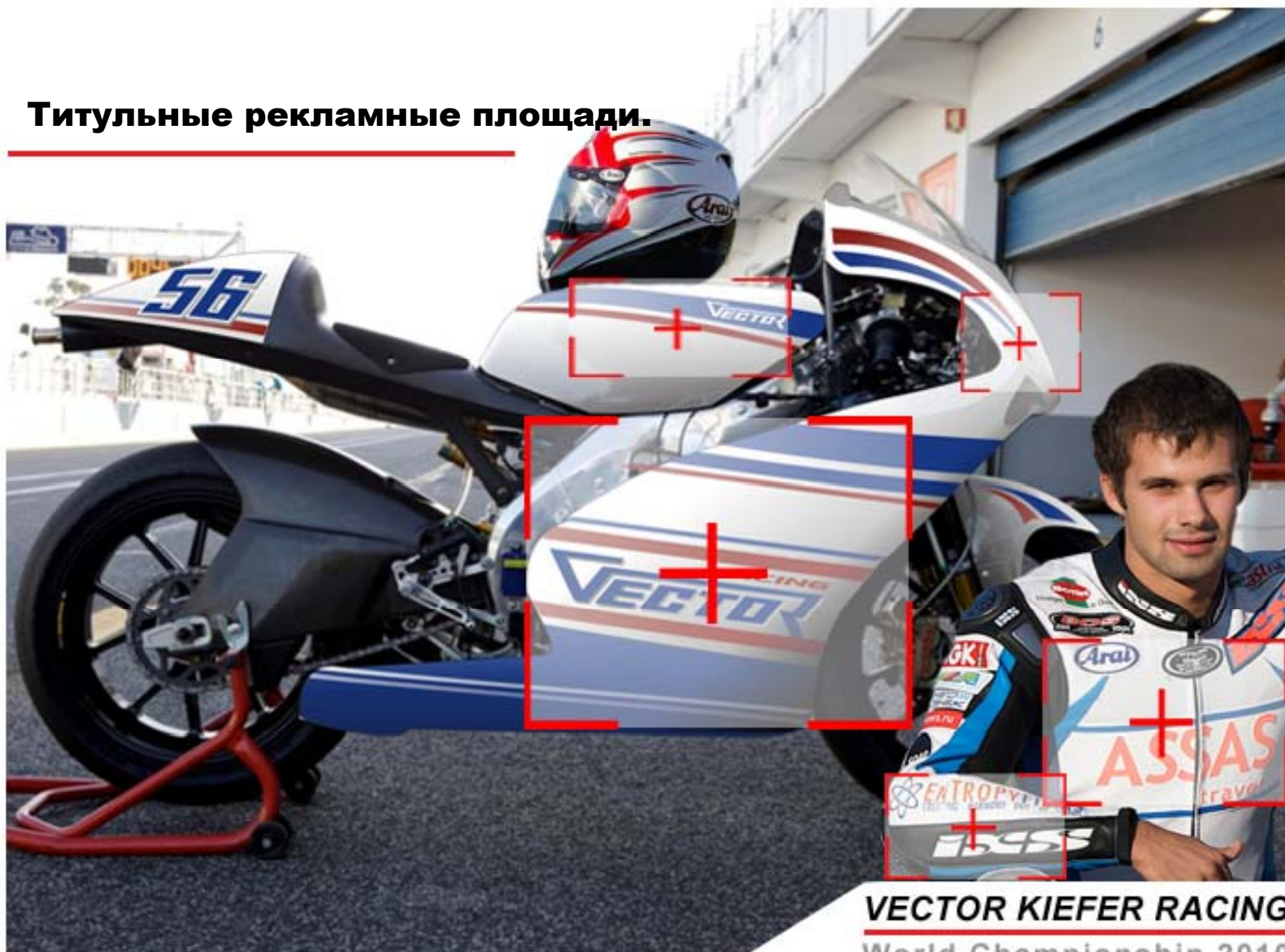
VECTOR KIEFER RACING World Championship 2010